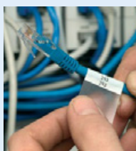
Etiquettes et manchons pour marquage de fils