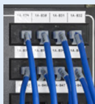
Communications voix et données