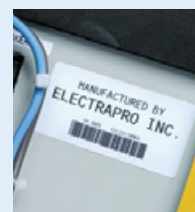
...Et plus encore !