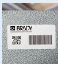
Etiquettes de suivi des actifs